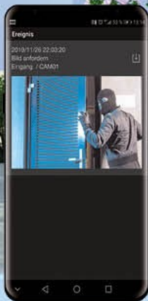
BILD / VIDEO

Ein Bild sagt mehr ... und gibt zeitnahe Information. Erst dadurch wird strategisch richtiges Handeln ermöglicht.